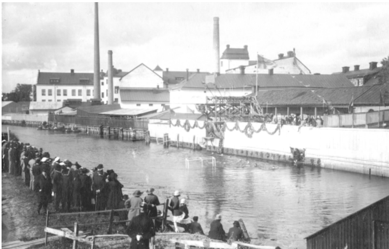
Uppsala sim- och badinrättning – Svartbäckens kallbadhus – var i drift åren 1857-1924.

H uruvida det badades i Fyrisån i äldsta tid är höljt i dunkel. Men vi vet att det skedde i organiserad form vid slutet av 1700-talet. Det var den Kalixfödde studenten, senare