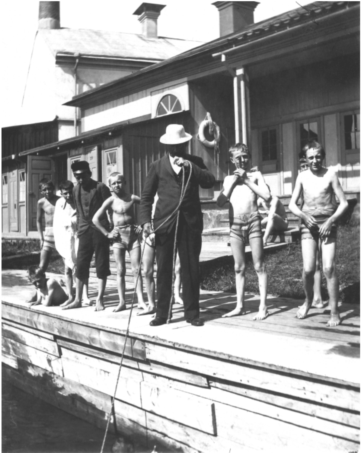
Simskola i Svartbäckens kallbadhus omkring år 1900.