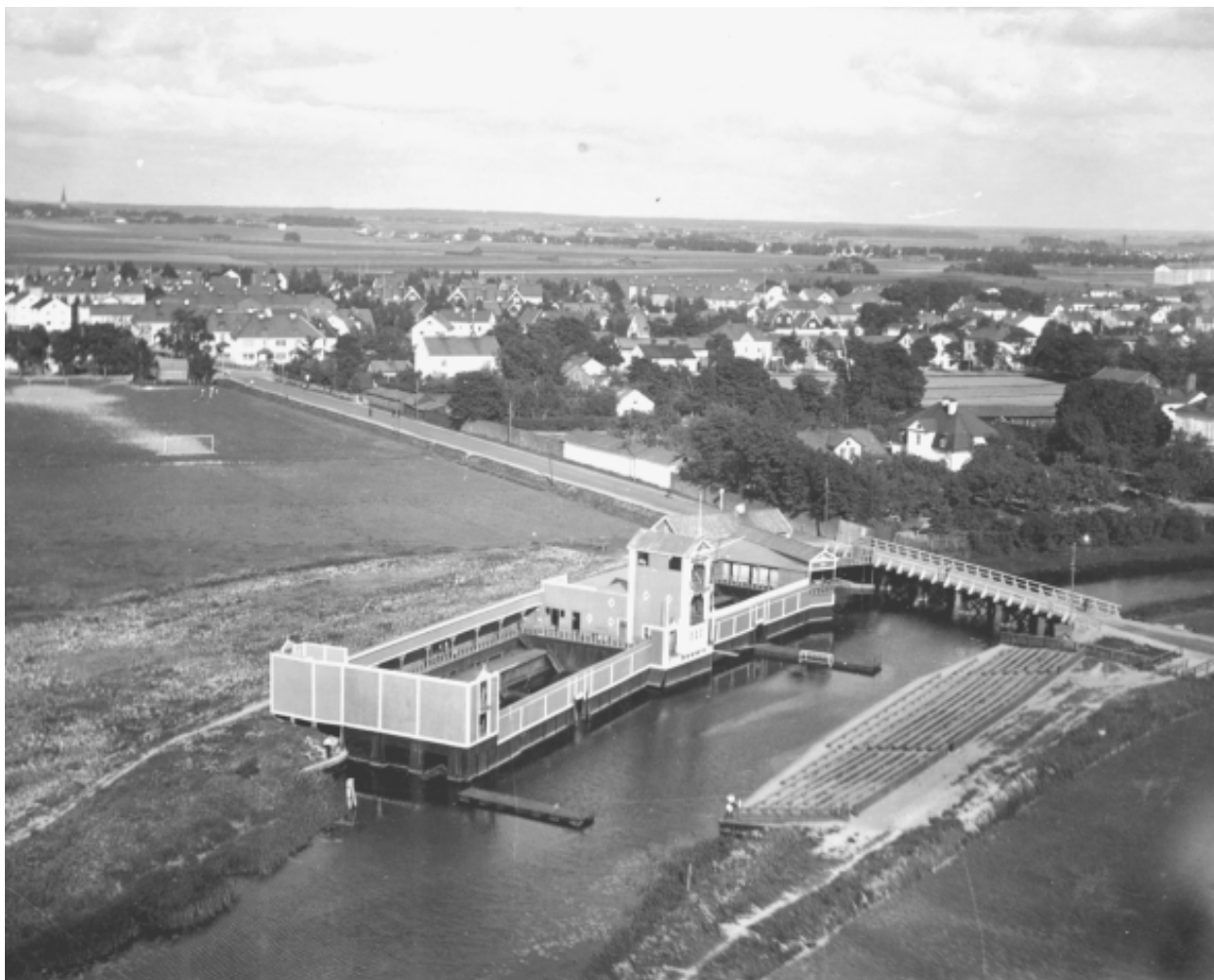
Fyrisbadet som invigdes 1925 var Sveriges då modernaste simstadion. Publikläktare fanns på motsatta stranden och i ån två bryggor med 50 meters mellanrum för kappsimning. Fortfarande var det Fyrisån man badade i och principen var densamma som i "Gamla kallis" med sumpar av olika djup och storlek. Hela anläggningen var dock större och man hade separata avdelningar för herrar och damer.