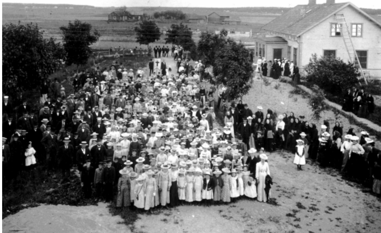
Söndagsskolan i Östervåla missionsförsamling samlad till fest under 1900-talets första år. Församlingens första missionshus syns i fonden.

till predikant- och pastorsbostad. År 1877 hade missionsförsamlingens medlemsantal vuxit så mycket att det motiverade att flera kretsar bildades, vilket i sin tur medförde att också flera missionshus byggdes. Församlingen hade till slut ett flertal missionshus som var lokaliserade över hela kommunen. Mer om Östervålas missionsförsamlings övriga missionshus och andra folkrörelselokaler kommer att framgå i den inventering av folkrörelsebyggnader i Heby kommun som arkivet utför och som beräknas vara färdig i början av 2011.