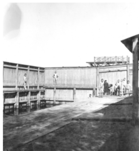
Den sk "Lusasken", kallbadhusets gratisavdelning som var avskild från den större inrättningen. Bakom planket sticker hopptornet upp på betalavdelningen.

Alla bilder och källor till artikeln är hämtade ur Uppsala Simsällskaps arkiv. Materialet ingår i utställningen Väder och oväder på Uppsala Stadsbibliotek, som invigs på Arkivens Dag den 13/11 och pågår t o m den 5/12.