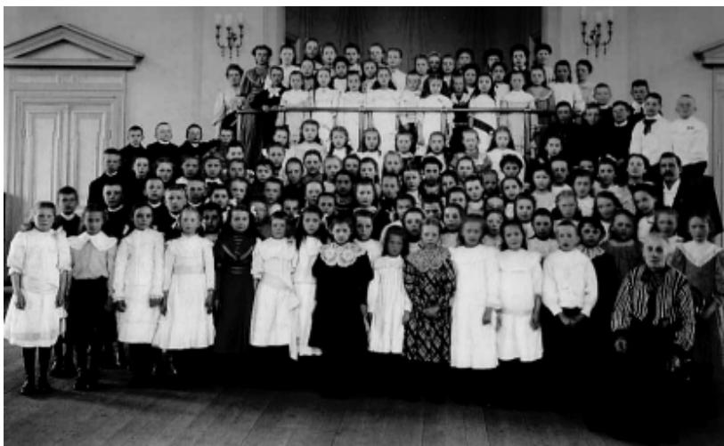
Barnkören samlad för fotografering i baptistkyrkan 1907.