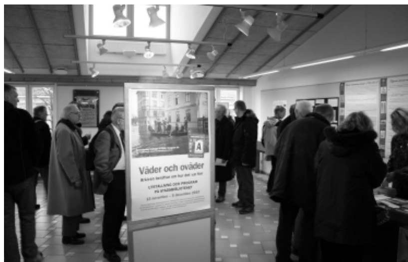
Arkivens dag på Stadsbiblioteket i Uppsala. Ett exempel på ABM-samarbete.

Samarbeten över ABM-gränserna i kombination med ny teknik kan även det öka tillgängligheten av material. Man kan tänka sig ett samarbete mellan ett museum och