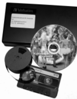
Gammal lagringsteknik ersätts av ny.

Men oavsett den nya teknikens möjligheter kommer det alltid att finnas ett behov av traditionella arkiv där historiskt material förvaras, och folkrörelsearkiven är nog exempel just på detta. Här finns en stor del av vår gemensamma historia från mitten av artonhundratalet och framåt bevarad. De stora folkrörelserna, fackföreningsrörelsen, frikyrkorna, kvinnorörelsen med flera berörde en stor del av befolkningen på något vis och formade samhället och på folkrörelsearkiven finns spåren efter detta bevarade.