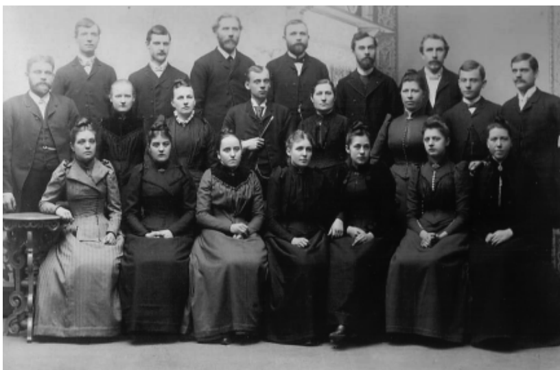
Sångföreningen Klippan 1891.

Se vår utställning "Fri att tro, Uppsala Baptistförsamling 1861-2011", som visas på Stadsbiblioteket i Uppsala 23 augusti - 5 september 2011.