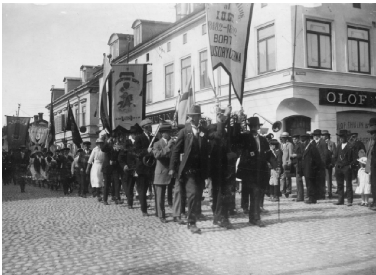
Nykterhetsdemonstration i Enköping 1916. De två främsta standaren tillhör IOGT-logerna 251 Enköpings Hopp och 187 Arvid August Afzelius. Standaren var stora, ofta över två meter höga, och bars på särskild stång med bärrem.

Under perioden 31 maj-18 juni visar arkivet upp några av sina fanor från nykterhetsrörelsen på Uppsala stadsbibliotek. Utställningen invigs tisdagen den 31 maj kl. 17:30 av Magnus Andersson, IOGT-NTO-distriktet i Uppsala. Utställningsperioden sammanfaller med Folknykterhetens Dag den 2 juni.