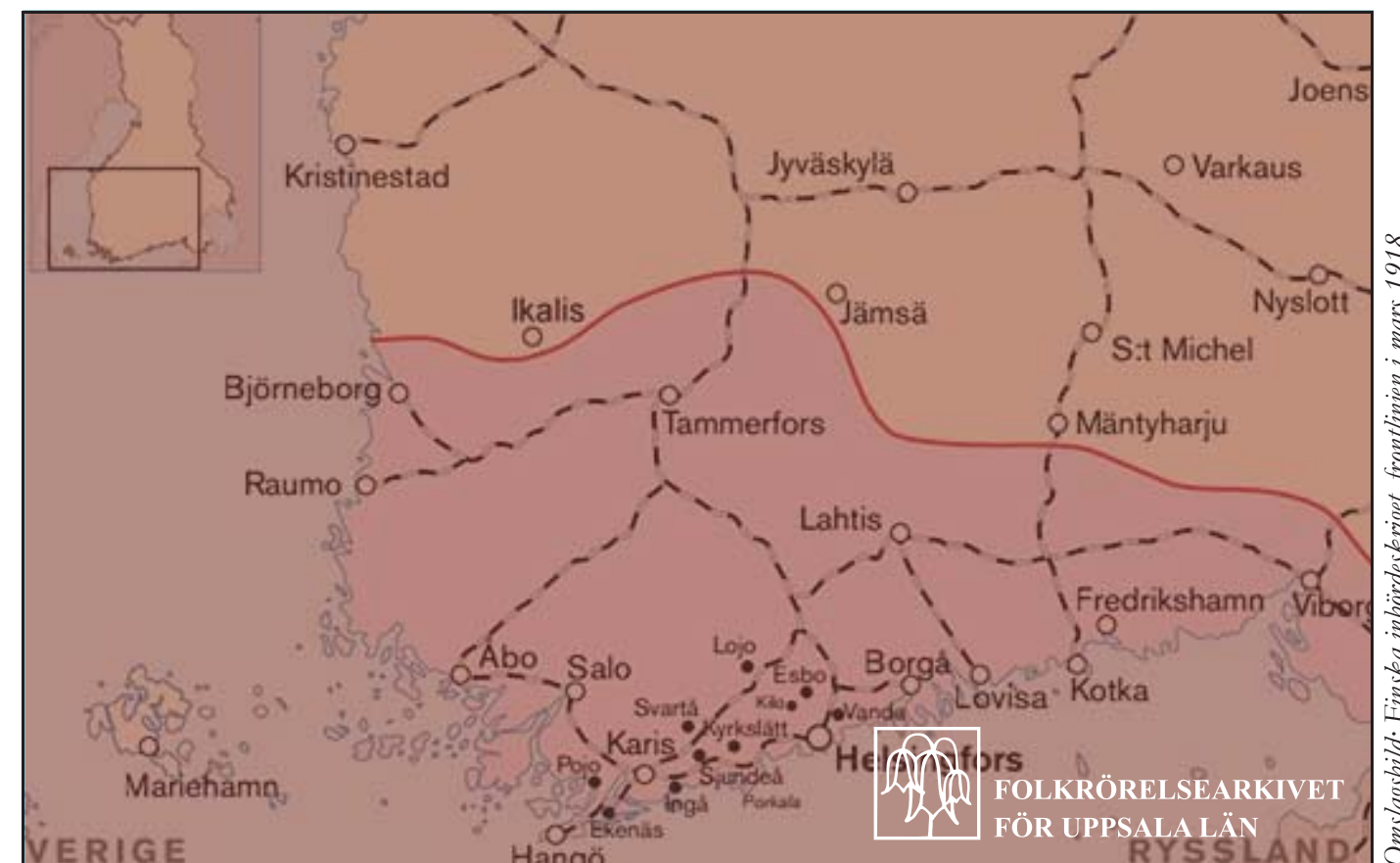
Omslagsbild: Finska inbördeskriget, frontlinjen i mars 1918.

Folkrörelsearkivet 1978 Finska inbördeskriget 1918 i en frontsoldats dagbok