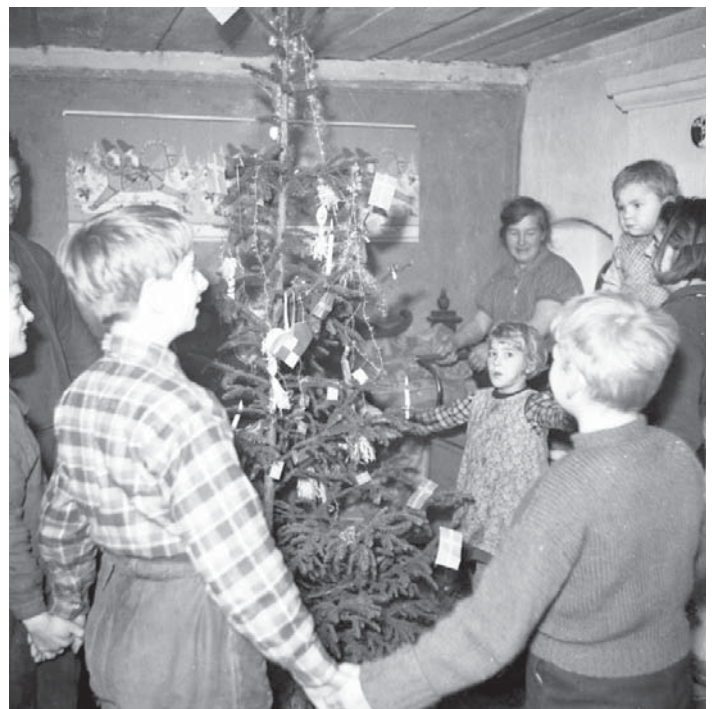
Trångboddhet var norm i arbetarnas Uppsala. Här julen 1942.