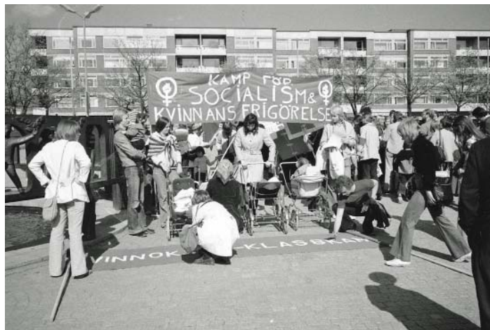
Grupp 8 laddar upp på Vaksala torg inför Första maj-tåget 1974.

Jämställdhetskampen har hela tiden strävat efter att göra kvinnor mindre beroende av män. I Sverige har ensamstående moderskap tack vare välfärden varit möjligt länge. Men med modern teknik kan en kvinna nu göra sig helt oberoende av män, då barnalstring är möjligt genom assisterad befruktning.