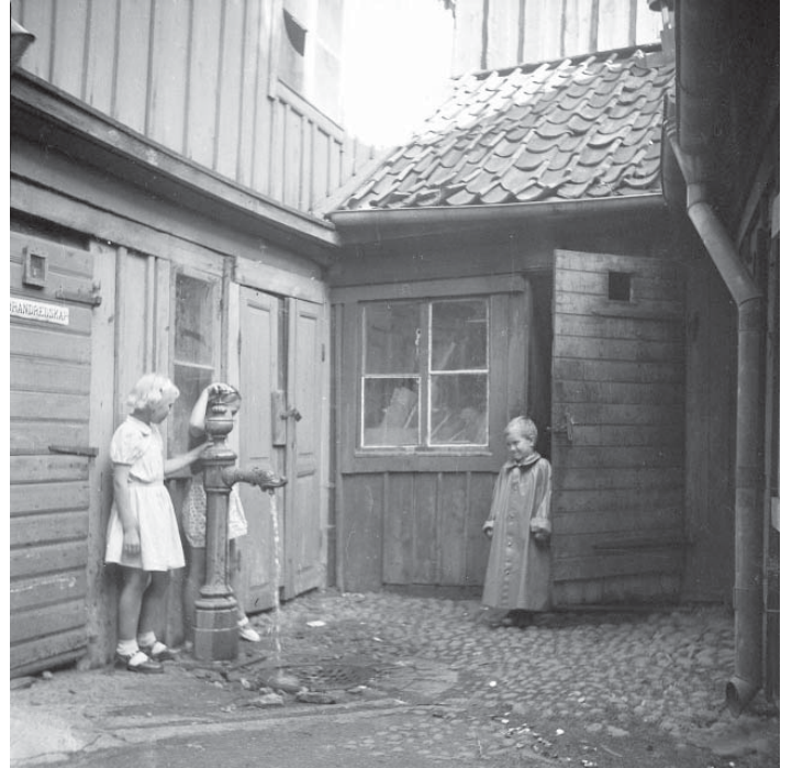
Typisk gårdsmiljö centralt i arbetarstaden Uppsala. 1940-tal, troligen vid Dragarbrunnsgatan.