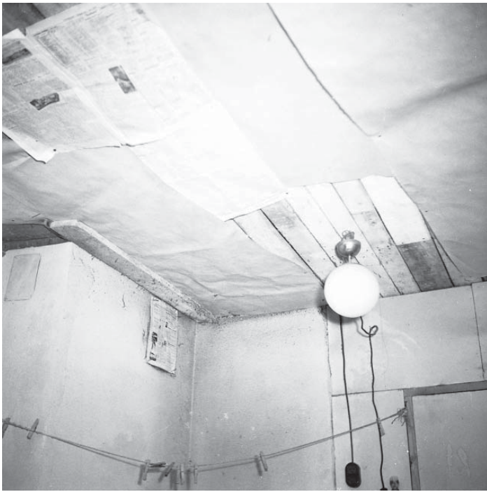
Någon renovering skedde inte i de gamla dragiga kåkarna. Med bland annat tidningspapper fick man en ytterst nödortffig isolering. Elektriskt ljus var den enda nymodighet som stod till buds. Foto: Aftontidningen, 1940-tal.