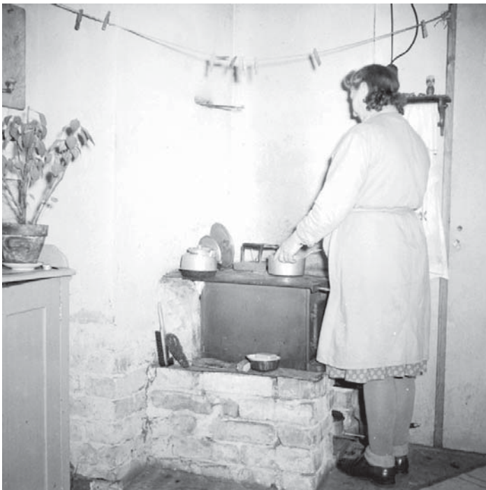
Riktiga kök var sällsynta i arbetarnas kåkbostäder. Foto: Aftontidningen, 1940-tal.