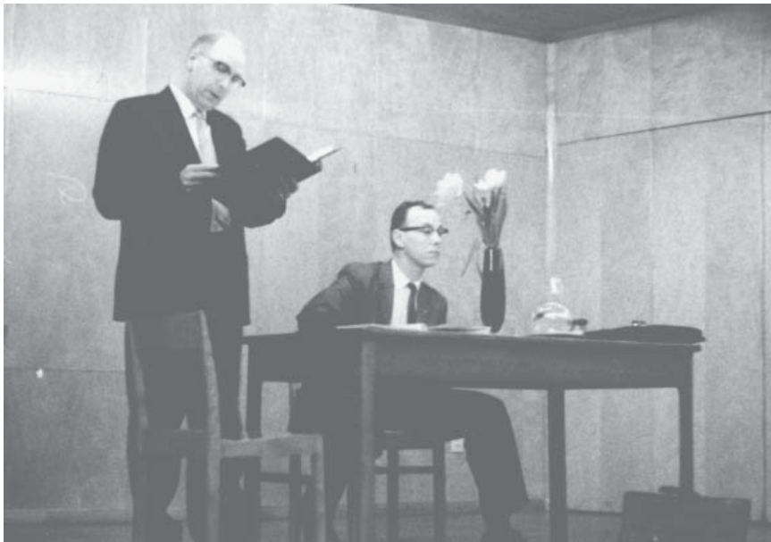
Äldre årsberättelser är skrivna för att läsas upp vid själva årsmötet. I mindre föreningar har de sannolikt inte mångfaldigats för att delas ut innan kopiatorer blev enkelt tillgängliga. Bilderna är tagna vid Typografförbundet avd. 84, Uppsalas årsmöte 1962.