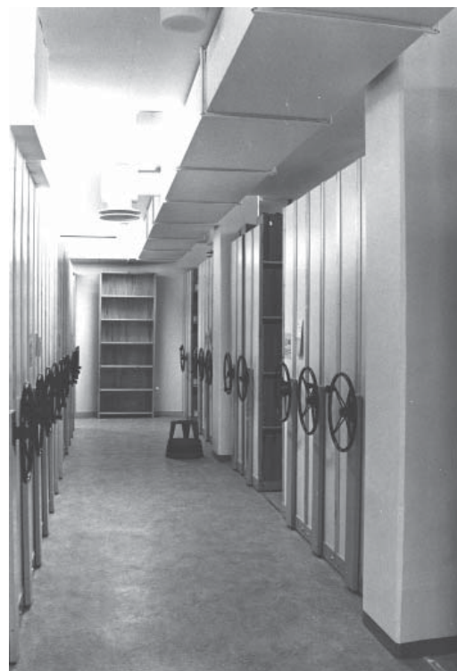
Folkrörelsearkivets depå 1988.

Det är nog inte alla deponenter som vet att avgifter för hyllmetrar inte börjar faktureras så fort ett arkiv har levererats. Först när ett arkiv har ordnats och förtecknats har vi börjat fakturera för hyllmeteravgift. Först efter förtecknandet har Folkrörelsearkivet uppfyllt sitt åtagande, är tanken. Skillnaden har tidigare inte betytt så mycket eftersom vi kunnat hålla jämna steg med förtecknande av leveranser, men de senaste åren har antalet oförtecknade arkiv ökat, så att vi nu har nästan 150 hyllmeter oförtecknat. Därför är ordnande och förtecknande av arkiv en prioriterad uppgift under 2020. Så om ni plötsligt för en ”saltad” räkning, då har vi skött oss.