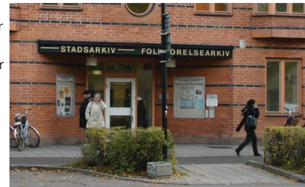
Folkrörelsearkivet hittar du på S:t Olofsgatan 15 i Uppsala.

Bildningsorganisationer Fackliga organisationer Freds- och försvarsorganisationer Fritids- och miljöorganisationer Handikapporganisationer Humanitära organisationer Idrottsorganisationer Kooperativa organisationer Kulturella organisationer Kvinnoorganisationer Nykterhetsorganisationer Person- och släktarkiv Politiska organisationer Religiösa organisationer Ungdomsorganisationer