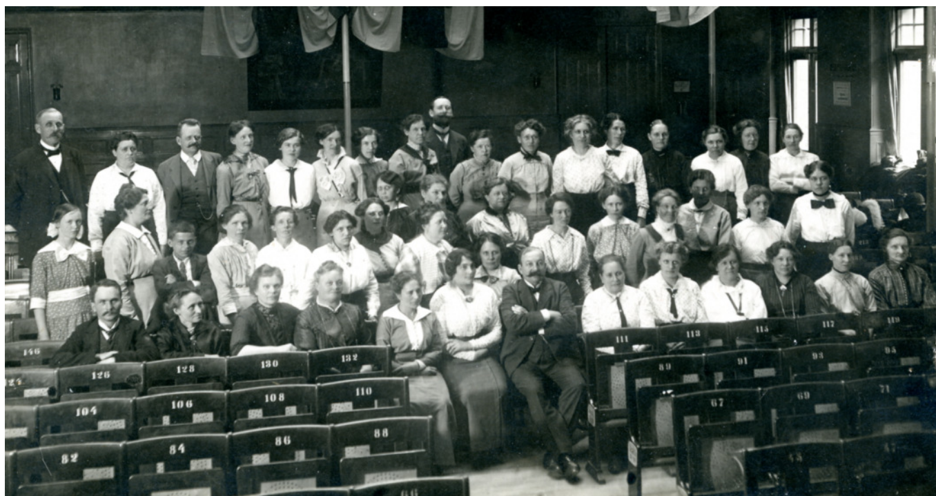
Kooperativa Kvinnogillesförbundets kongress 1915, Folkets Hus i Stockholm.

I Uppsala stads telefonkatalog från 1931 hittar vi Svenska hem på Gropgränd 4 som är en mondän adress i kvarteret Kamphav, vilket ger en antydning om att förklaringen ovan kan vara riktig. I Pelle Svanslös är detta "stans finaste kvarter" - åtminstone enligt Elake Måns som bodde på Gropgränd, om än i en dragig källarglugg!