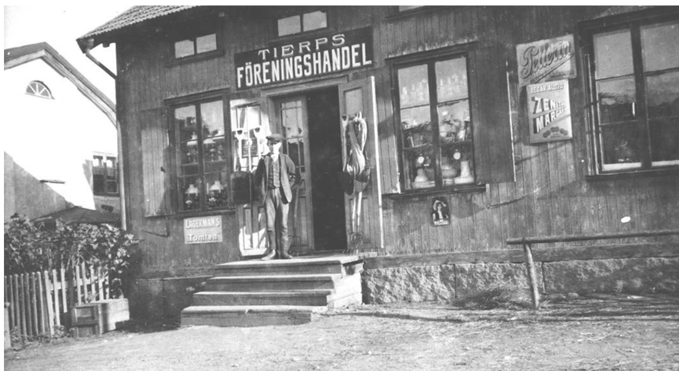
Tierps södra konsumtionsförenings butik i Gryttjom 1906-1910.

På flera andra håll i länet bildades under 1900-talets första år olika kooperativa föreningar. Många var verksamma endast en kort tid, till exempel Tierps södra konsumtionsförening som grundades 1906