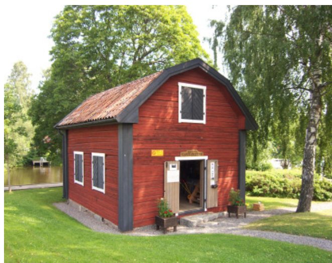
Handelsmuseet Kappen i Örsundsbro. Här låg Sveriges första kooperativa butik, öppnad 1850.