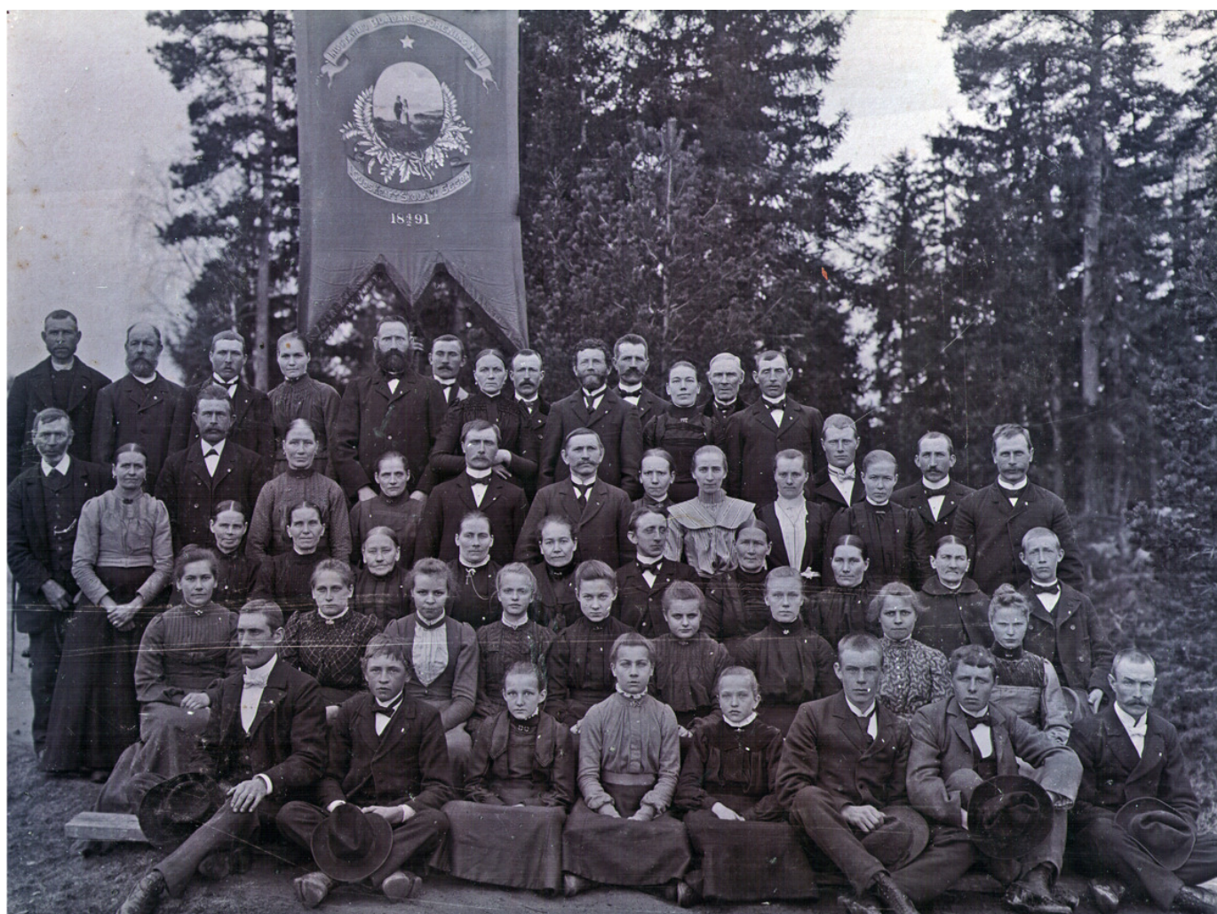
Ingstarbo blåbandsförening, en av de föreningar som arrangerade Leufsta bruks musikkår. Texten på standaret lyder: "Ingstarbo blåbandsförening No 11" / "I Guds kraft skola vi segra" / "18 4/2 91". Bilden finns i Lövstabuks hembygdsförenings fotosamling och har där nummer 2008. Fotograf okänd.

början som inomkyrklig och präglades av ett flertal "läsarpräster" som aktiva medlemmar. På 1870-talet gick flera av prästerna ut ur missionsföreningen och lämnade verksamheten i lekmännens händer. De frikyrkliga idéerna bröt därpå igenom och egna församlingar började bildas. En av dessa var Leufsta friförsamling (senare Österlövsta friförsamling, senare Österlövsta missionsförsamling), bildad 1878, och i närliggande Hållnäs bildades en friförsamling några år tidigare, 1867. 17