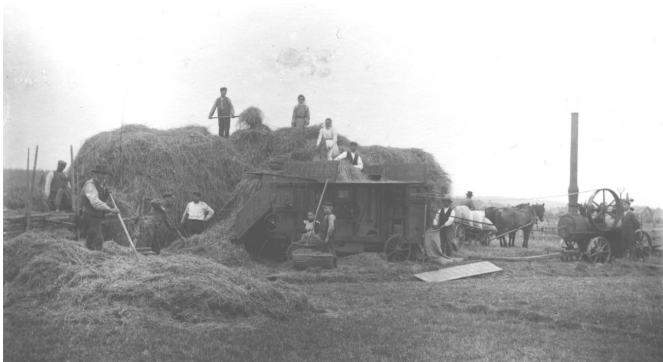
Tröskning med lokomobil som dragkraft u å.

I slutet av 1800-talet började biodlare gå samman. Uppsala Biodlareförening grundades redan 1888, senare tillkom andra runt om i Uppland och ett länsförbund bildades 1917.