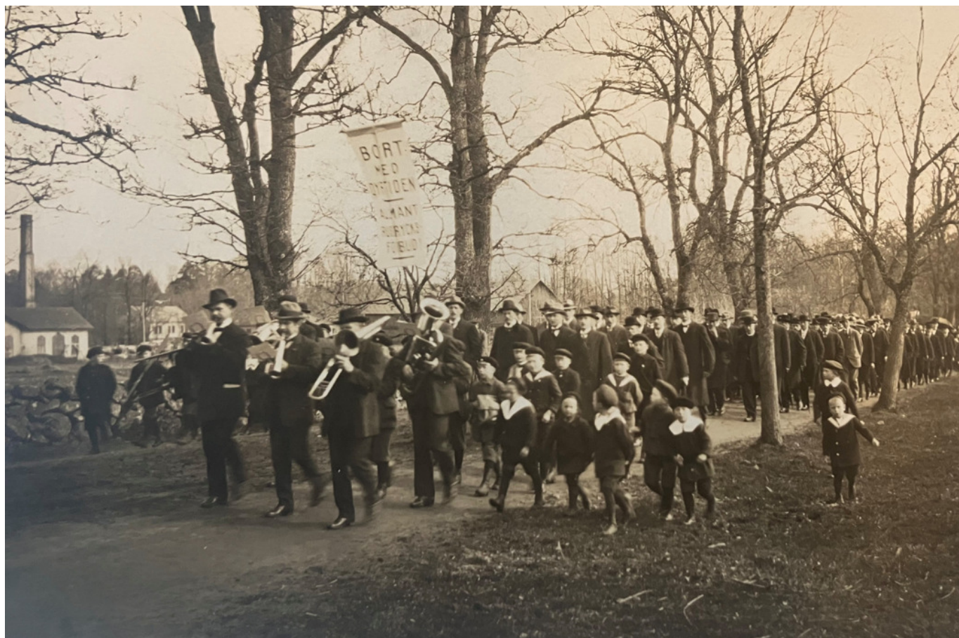
Leufsta bruks musikkår först i ett demonstrationståg i Lövstabruk. I bakgrunden syns en del av smedjan. Texten på standaret är suddigt men troligen står det "Bort med dyrtiden – Allmänt rusdrycksförbud". Enligt uppgift ska bilden visa en 1 maj-demonstration. Bilden finns i Lövstabruks hembygdsförenings fotosamling och har där nummer 300. Fotograf okänd.