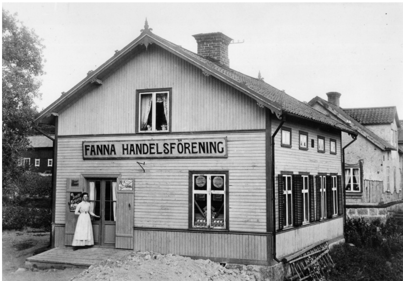
Fanna Handelsförening, Enköping, u. å.

diskuteras nykterhetssaken och mötet avslutas med sjungande av Internationalen.