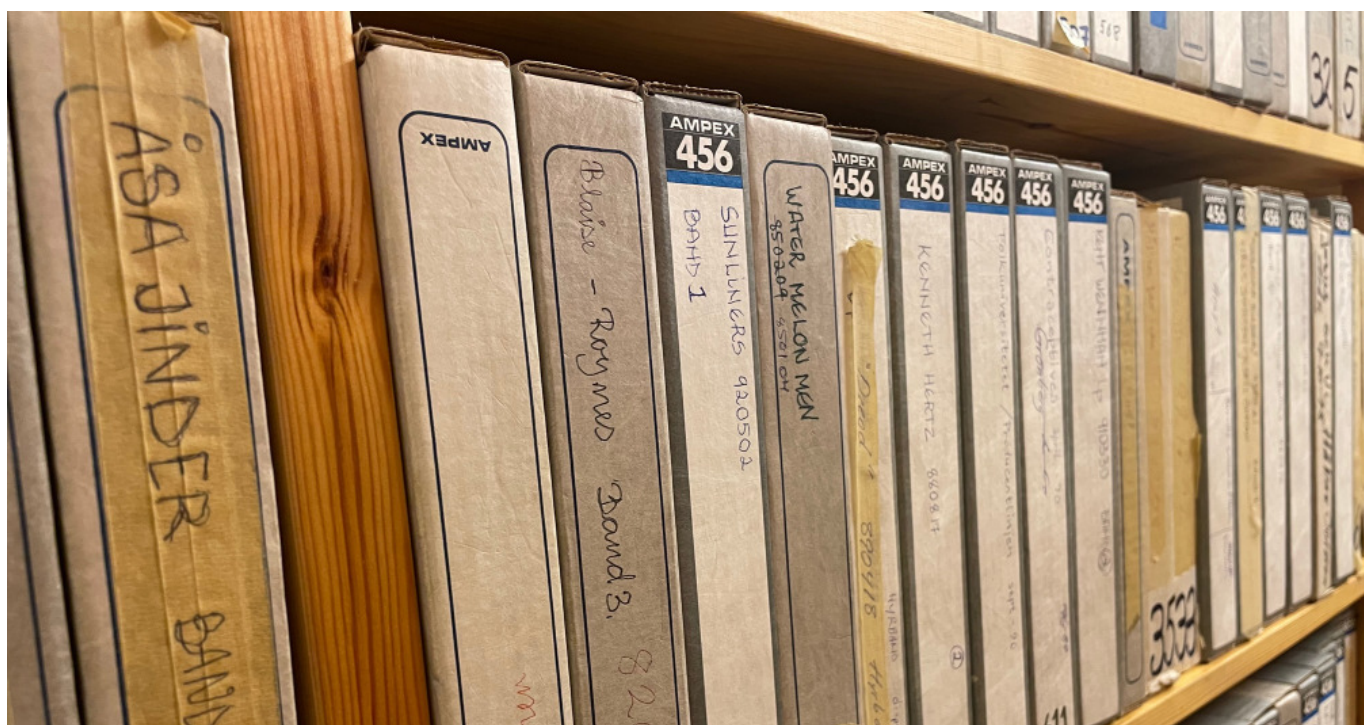
Folkrörelsearkivet har övertagit ansvaret för Studio 55; ett arkiv på cirka 50 hyllmeter som till stora delar består av ljudinspelningar på rullband, kassetband, DAT med mera. Samlingen levererades till arkivet i slutet av november 2021.