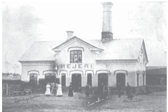
Mejeriet vid Strömsbergs bruk 1896. Ännu 1913 dominerade uppköpsmejerier i antal i Uppsala län, men 25 år senare var drygt två tredjedelar av mejerierna sådana andelsmejerier som Tolfta sockenförening planerade.

Man kan tala om 1910- och 1920-talet som en period av organisering av jordbrukarklassen, eller lantmännen, på flera plan. Det är lätt att idag glömma hur talrik denna klass av småbrukare var. Ännu under 1920-talet syssetts jordbruket fler än industrin och det är de mindre familj jordbruken på upp till 20–30 hektar som utgör huvuddelen. Bondeförbundet bildades 1921 och innebar en förnyelse av partiväsendet. Riksdagspartiet Lantmannapartiet hade funnits sedan tvåkammarriksdagens första tid, men hade allt tydligare blivit ett parti för storbönder och under 1910-talet slutligen