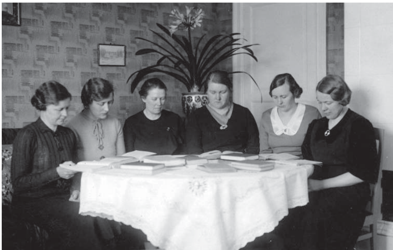
Skutskärs socialdemokratiska kvinnoklubb, cirka 1935. Från studiecirkel om Kvinnans ställning genom tiderna.

Radikalismen i många av dessa sånger står också som en påminnelse om hur mycket politiska identiteter har förändrats under det