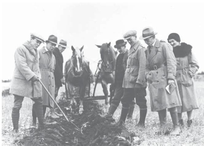
Plöjningstävling i Boo gård, Tolfta s:n, 1932. En del av jordbrukarnas organisering syftade till att upprätthålla kvalitet i arbete och produkter, bland annat genom tävlingar och utmärkelser. Att plöja raka fårar var en konst som bedömdes av en kunnig jury.

Även idag finns enskilda vägföreningar; med "det medeltida" vill jag inte antyda att fastighetsägares väghållningsansvar är föråldrat. Det som väcker intresse är att sockenföreningen är en ny organisation som tar sig an en gammal funktion som bönder har behov av.