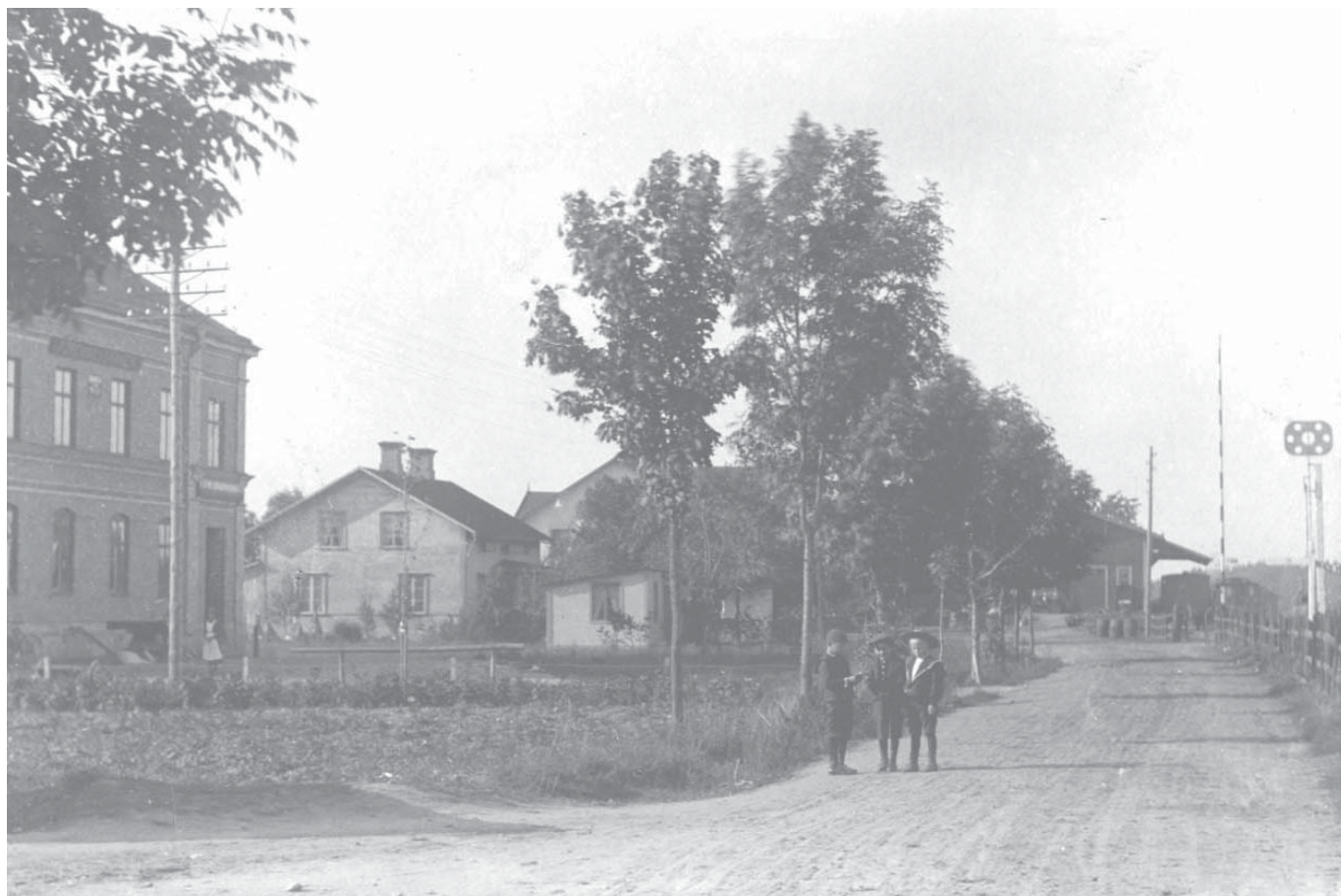
Centrum i Tierps municipalsamhälle 1904. Tierp blev 1888 ett municipalsamhälle i södra delen av Tolfta socken. Liksom bruken hade municipalsamhällena ett visst självstyre inom en landsbygdskommun. 1920 blev Tierp köping och bröts ut från Tolfta som en egen kommun. År 1952 var det istället Tolfta som införlivades med Tierps kommun. Trots att bilden inte ger intryck av en metropol så urskiljde sig Tierp som en mer urban miljö och som en framväxande industriort.

bidrog sannolikt till valresultatet. Av de tre föreningarna är arbetarekommunen den förening som mest påminner om en modern partiförening. När det socialdemokratiska arbetarpartiet grundades 1889 var möjligheterna att komma in i riksdagen små. Rösträtten i Sverige var starkt begränsad och relaterad till inkomst vilket effektivt stängde ute arbetarklassen. För socialdemokraterna blev strategin därför tidigt att etablera lokala partiorganisationer runt om i landet som kunde verka för allmän och lika rösträtt och så småningom ett intåg i riksdagen.