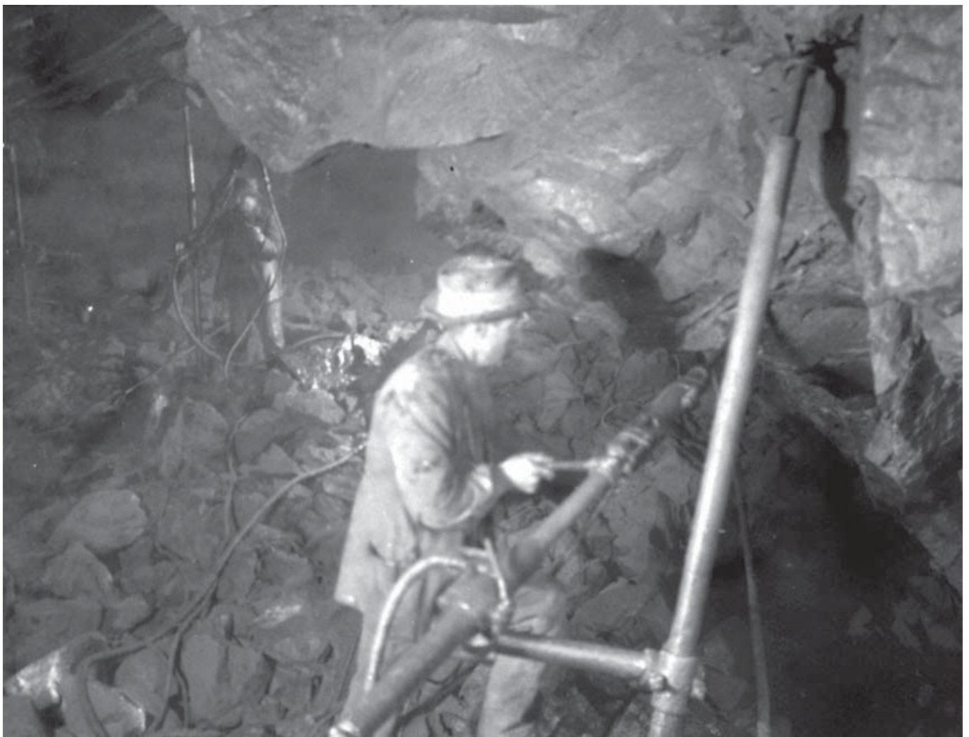
Dannemora gruvor 1927.

En presentation av utställningens grundform kommer inom kort att vara färdig. Då kan ni som är intresserade av att få den till er ort eller till er föreningslokal se vilka format och vilket grundinnehåll som erbjuds och sedan kontakta oss för en bokning.